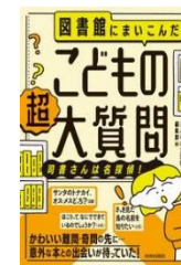
こどもの大質問編集部/著 出版社 青春出版社 発売 2024年 請求記号 015.2