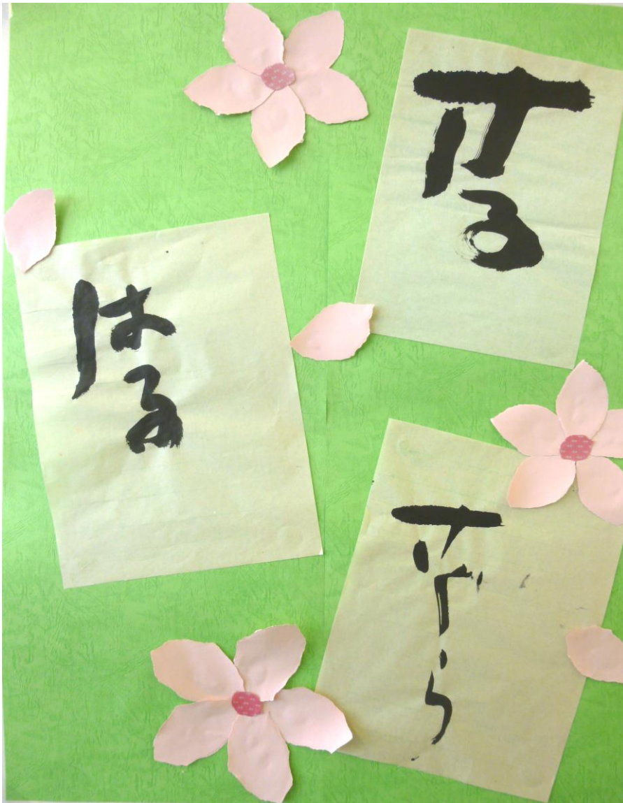
メッセージ：書道の時間に書いた字を集めて作品にしました。 「さる」はハッピーガーデンで作った今年のカレンダーにも使われています。

表紙絵 「僕の字を見てください」 書道が好きな方さん (わらしべ会ハッピーガーデン)