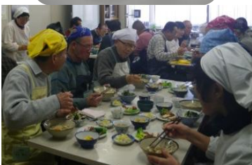
試食タイムは会話が弾みます