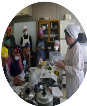
講師は大阪友の会皆さま

2月9日(火)、16日(火)の2日間、恒例の「男の料理教室」を当センターで開催しました。今回は、さんまの缶詰を使ったひつまぶし風や余熱を活用した鶏むね肉の煮物、コーヒーチキン、万能だれを使った炒り鶏、葱の肉巻きなど、手に入りやすい素材を使ったお洒落なおばんざい料理です。