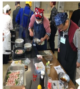
「かみさんの苦勞がわかった～」

参加者の皆様からは「大変役にたった」、「通常の家庭料理が一段ランクアップした」、「九条葱の肉巻きに早速挑戦しました。」