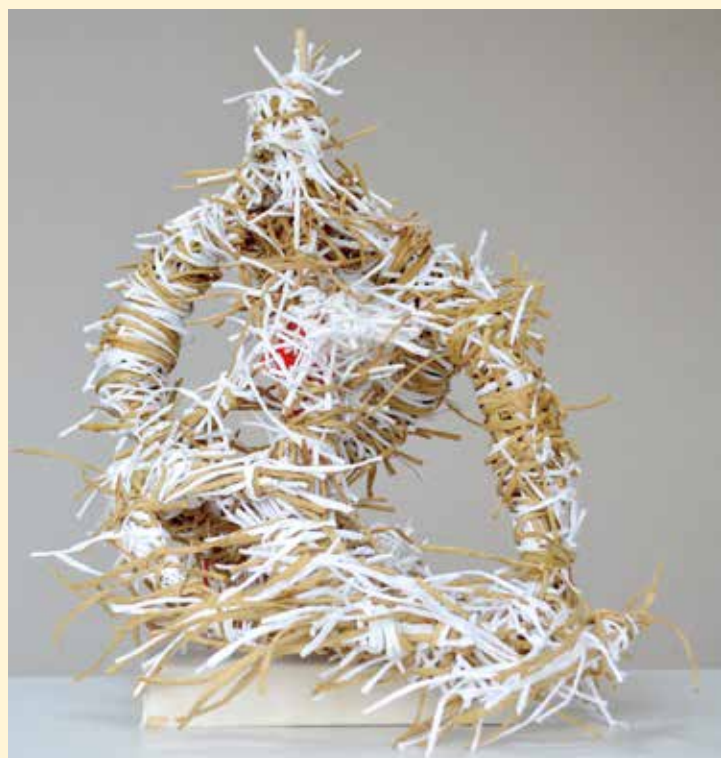
スマイルゲート長尾倶楽部の生徒作品