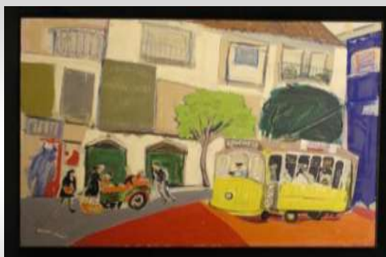
「リスボンの電車」井口一朗作 (油彩) 1943 (昭和 18) 年卒業