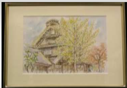
「晩秋(白川の民家)」花本正一作 (水彩) 1944 (昭和 19) 年卒業