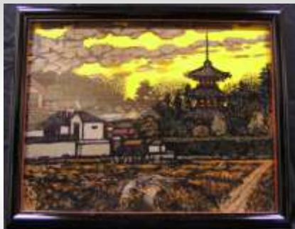
「方輪寺展望」野沢寛作 (油彩) 1929 (昭和 4) 年卒業