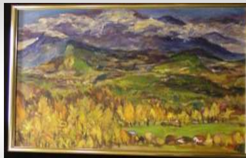
「山麓」安達良雄作 (油彩) 1934 (昭和 9) 年卒業