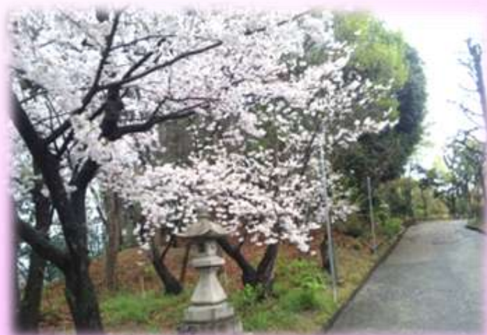
(平成 29 年 4 月撮影)