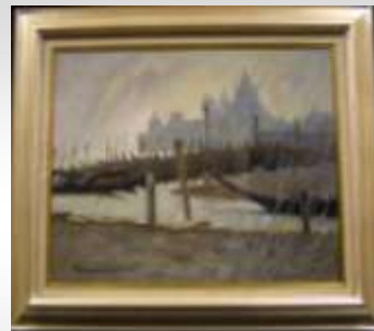
「驟雨のベニス」阪井谷松太郎作 (油彩) 1929 (昭和 4) 年卒業