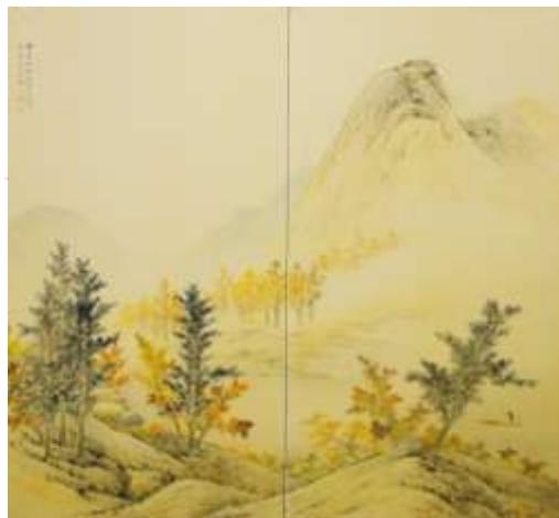
下右： 「春山帰牛図」 橋村作