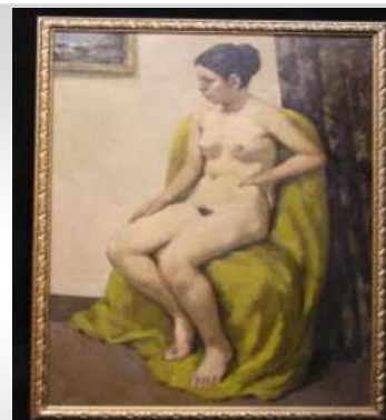
「室内裸婦」小溪住久作 (油彩) 1944 (昭和 19) 年卒業