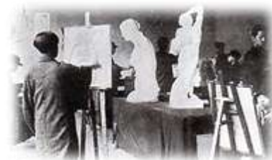
(大阪美術学校西洋画室)